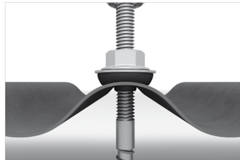
Detaliu imagine: șurub de ancorare cu garnitură de etanșare FZD